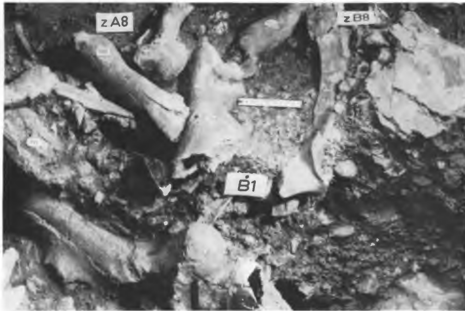
Grotte du Vallonnet: Grabung in den Zonen A 8 und B 8. Knochen in situ in der Villafranchien- schicht B 1.